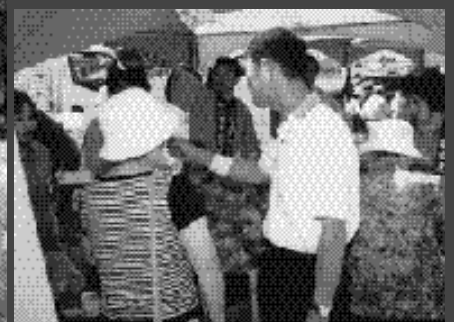
栃木県佐野市からの出店です