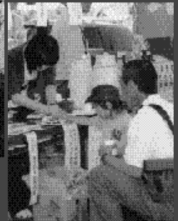
埼玉県鶴ヶ島市からの出店です