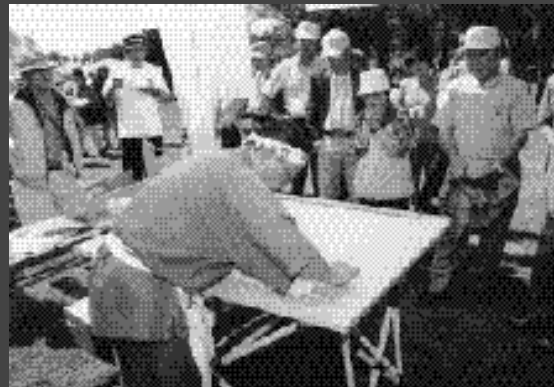
手打ちそばの実演には大勢の見物客がいました