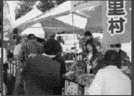
新潟県清里村からの出店です