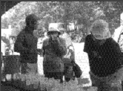
清里には焼酎です！お味はいかがですか