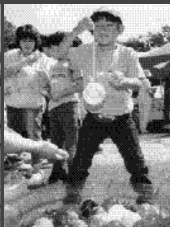
上手に釣り上げられたね