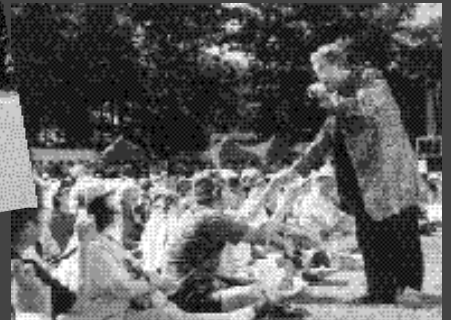
ラジオでお馴染みの嶋 淳一さんです