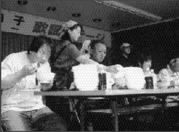
清里産そば大食い大会で何杯のそばを食べたでしょう 美味しそうな香りが漂っています