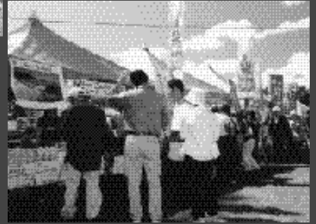
今年も好評だったNZフェア