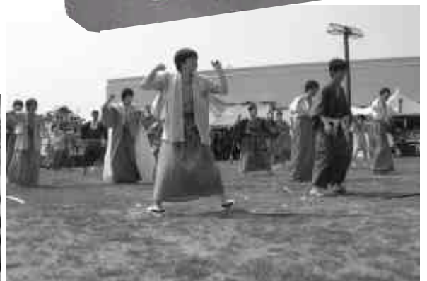
息のあった踊りを披露した2年生