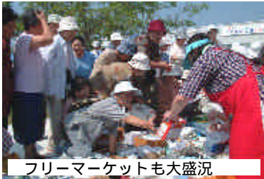
フリーマーケットも大盛況