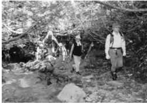
この後、大勢の方が斜里岳頂上目指し登りました

登山者の無事を祈る安全祈願祭には家族連れなど100人を超える参加者が集まりました。