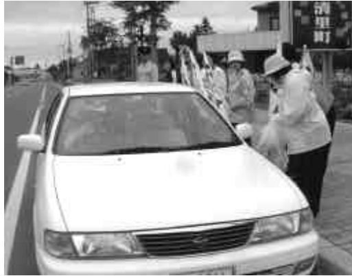
常に安全運転を心がけてください

この日は、全国青年大会創作芸能の部で日本一になった、清里町連合青年団による清里龍神太鼓の演舞と、地元の江南小学校児童や先生などによる龍神の舞が披露され、20年の節目を迎えた龍神神社をお祝いしました。