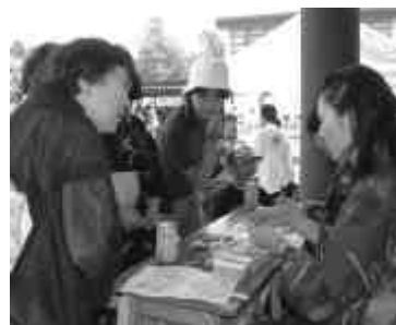
町民とのふれあいがテーマ