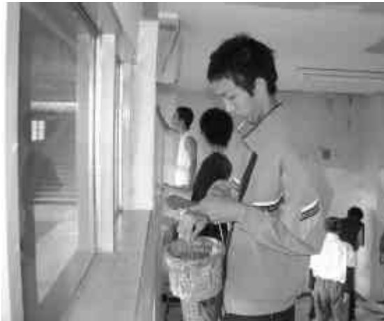
汚れていた壁も白いペンキできれいになりました

7月8日、清里町駅に花や詩などを飾る活動をしているボランティアアサークル「清里町駅なごみ会」の呼び掛けにより、「清里高校の生徒」による清里町駅舎内のペンキ塗り作業が行われました。