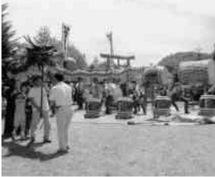
清里の伝統芸能である龍神太鼓