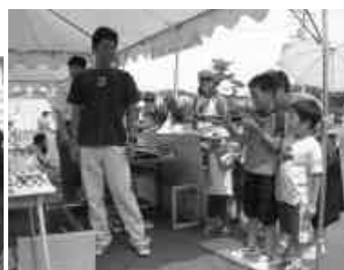
欲しい商品をよく狙って