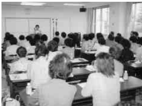
犯罪がなくなる地域をめざしています

7月21日、プラネットを会場に、今年で創立20年を迎えた清里町更生保護女性会主催による、