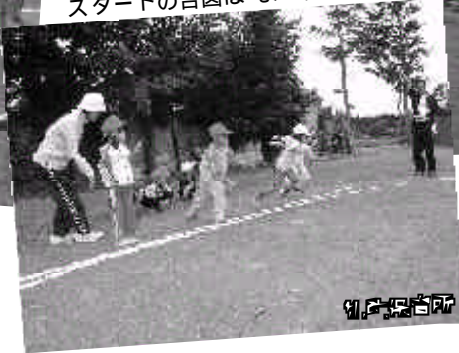
スタートの合図は「よーい」ドン！