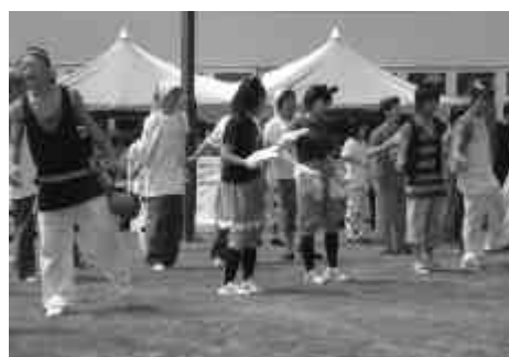
初めての清高祭となる1年生も頑張った