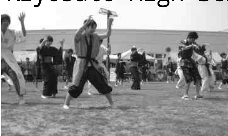
3年生にとっては最後の清高祭なので気合いの入り方が高いです