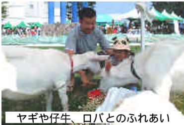
ヤギや仔牛、ロバとのふれあい