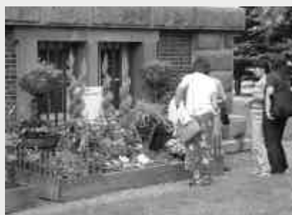
出展した清里町のモデルガーデン

「赤れんが」の愛称で親しまれている、旧北海道庁赤れんが庁舎の前庭を舞台として、7月23日(金)~8月1日(日)にかけて行われた「赤れんがフェスタ」。 道内各市町村の自慢の花を飾る「北海道フラワーガーデン」に清里町のモデルガーデンを出展して参加しました。 このイベントには期間中に全国から約20万人の方が来場し、全国花のまちづくりコンクールで日本一に輝いた清里町の花の取り組みに興味を持つ方が数多くいました。