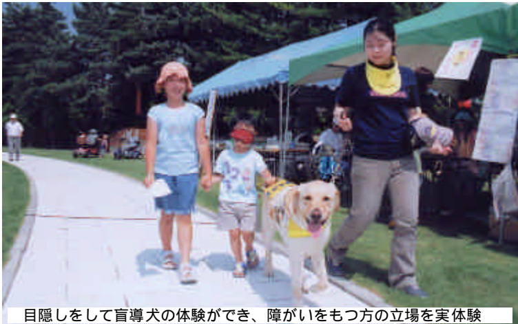
目隠しをして盲導犬の体験ができ、障がいをもつ方の立場を実体験