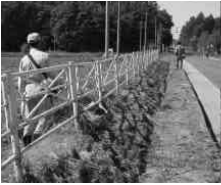
地域づくりは自らの手で

この日は、メンバー30人が草刈り機やトラクターなどの機械を持参し、道路脇に伸びている雑草を刈りました。