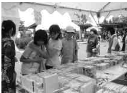
夏休みに入った中学生も遊びに