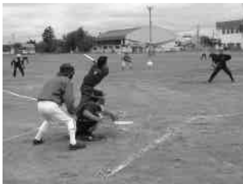
どの試合も乱打戦で白熱した展開に

7月4日、町民グラウンドで自治会対抗ソフトボール大会が行われました。大会には7チーム（自治会）、約130名が参加し、どの試合も乱打戦で白熱した好試合が展開されました。接戦を制して、みごと優勝の栄光を勝ち取ったのは羽衣町第1自治会。勝利の喜びを全員で味わっていました。