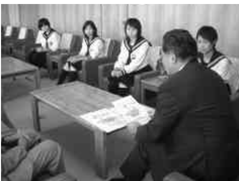
それぞれ練習の成果を出し頑張ってください

清里中学校の剣道部が、紋別市で行われた中体連の管内大会において、女子団体戦で優勝、