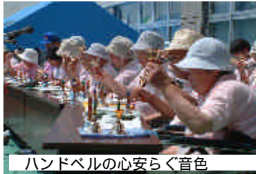
ハンドベルの心安らく音色