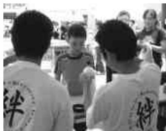
かき氷は冷たくておいしいよ