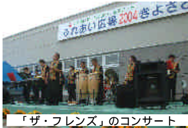
「ザ・フレンズ」のコンサート