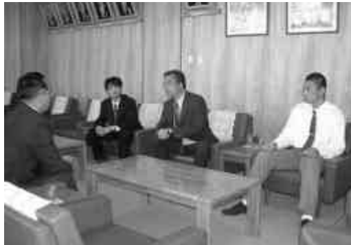
自己新記録を目指して頑張ってください