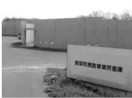
売却が決定した旧ホテルポリニーヤ