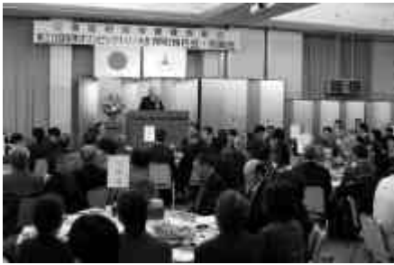
約280人が出席した帰町報告会

今回の補正は、4月22日に行われた岡崎朋美さんトリノオリンピック入賞に係る町民栄誉賞表彰式並びに帰町報告会・入賞祝賀会に要する経費を専決処分により行ったものです。 補正額 335万円 補正後の予算総額 41億4千785万円