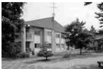
リバーサイド団地