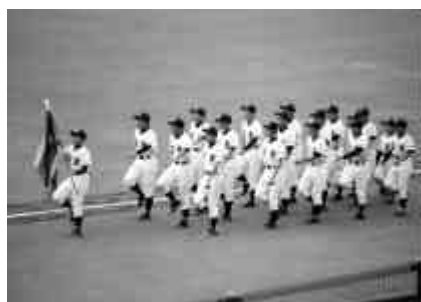
北海道代表として堂々の入場行進