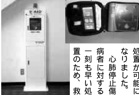
自動体外式除細動器(AED)

応急手当講習会(AED講習・一般講習)を行っています 清里分署では、応急手当や心肺蘇生法など救急処置に関する知識や技術等の普及のため「応急手当講習会」を行っています。今年から一般の方も使用可能となりましたAEDの講習も行っていきます。応急手当の講習会を希望される自治会や団体等がありましたら、お気軽に清里分署救急係までご連絡ください。