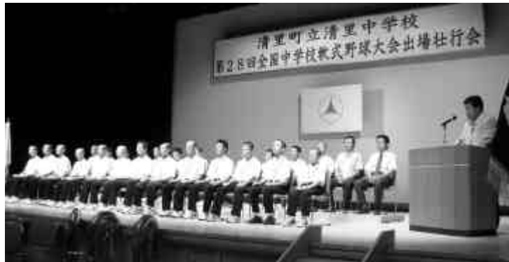
全国大会出場壮行会