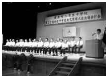
多くの人が集まった壮行会

翌23日に、四国地区代表の香川県丸亀市立飯山中学校との対戦が行われました。2回に先制点を取られましたが、その裏すぐに反撃し、無死1・2塁のチャンスから同点、追加点と逆転に成功。途中までリードを保