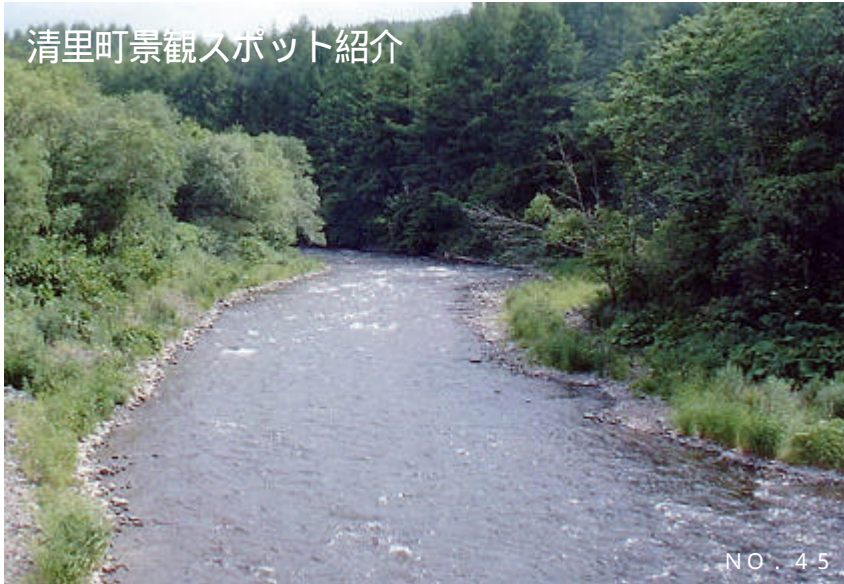
「清流の谷コース(ウォーキング)から見る斜里川」