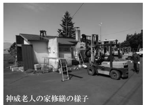
神威老人の家修繕の様子

提案された事業は、事業の周知及び多くの町民に情報を公開する目的で、個人情報などを除きホームページに掲載します。