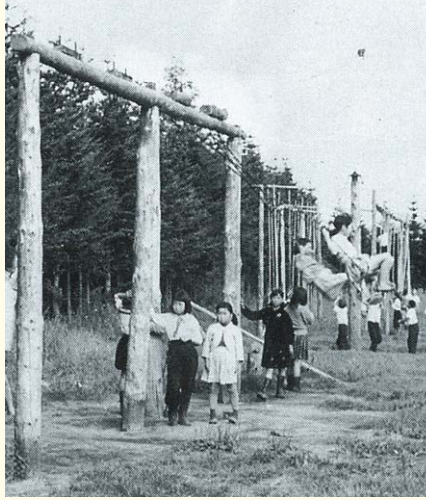
グラウンドに設置された遊具（昭和30年代）