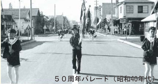
50周年パレード（昭和40年代）