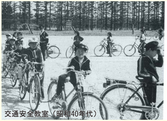
交通安全教室（昭和40年代）