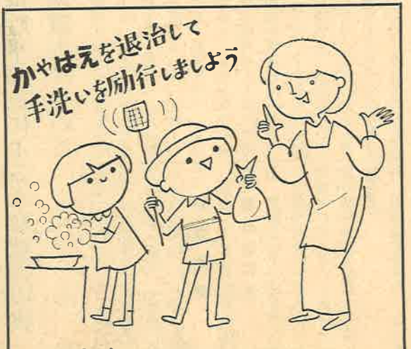
赤痢・腸チフスに注意