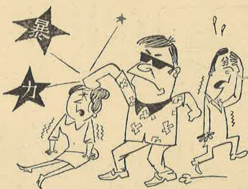
暴力の被害は必ず届けよう

毎月の開設日はその都度広告しておりますが、人権問題以外の法律相談にも応じておりますので、どしどしご利用下さい。