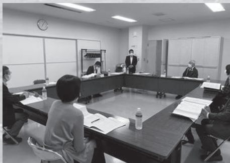
学校教育グループ