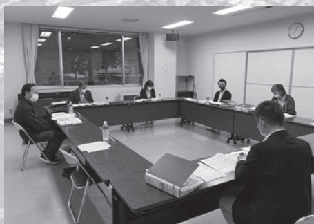
保健・医療・福祉グループ