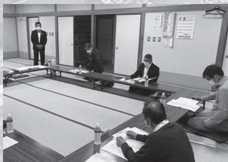
生活環境・基盤グループ