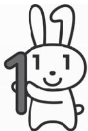
マイナンバーカード PRキャラクター 「マイナちゃん」

※国としては、令和3年3月の 利用開始時に6割程度、令和 5年3月末には概ね全ての医 療機関などでの導入を目指し ています。