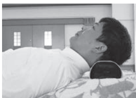
高い枕は上を向きにくい