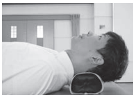
低い枕は上を向きやすい

「頸椎症」は上を向く動作や首を傾ける動作を繰り返すと悪化していきます。進行すると神経を圧迫し、麻痺になる可能性もあります。壊れた関節は元に戻らないので、上を向かないように枕を高くする必要があります。