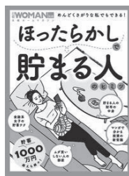
ほったらかして貯まる人のヒミツ 日経BPムック 編