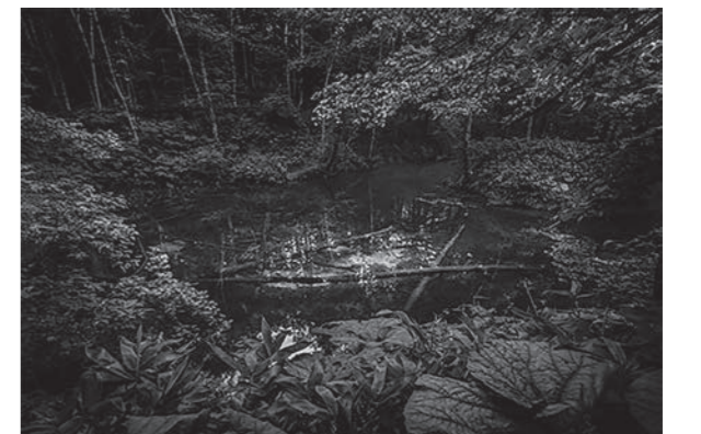
村特別賞受賞作品「神秘的泉」 撮影地：神の子池

■問い合わせ 「日本で最も美しい村」連合 清里事務局 (企画政策課まちづくりグループ ☎ 25-2135)