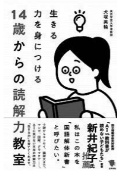
14歳からの読解力教室 ／犬塚 美輪 著