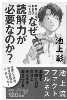
なぜ、読解力が必要なのか？ ／池上 彰 著